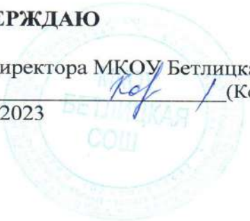
График оценочных процедур МКОУ Бетлицкая СОШ на 2023/24 учебный год